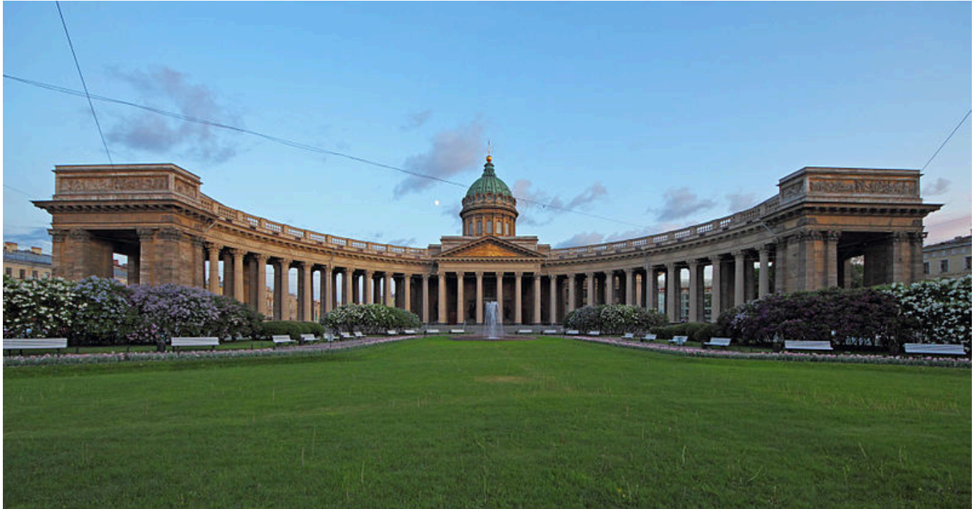
Kasaner Kathedrale, St. Petersburg