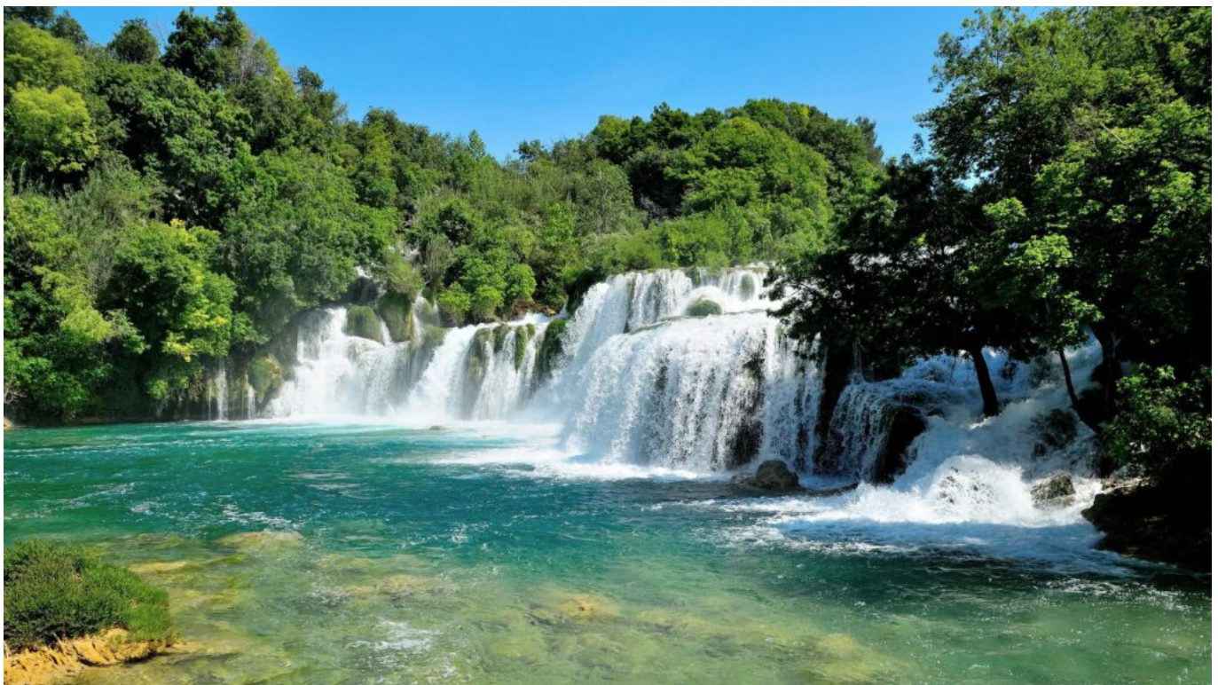
Krka Wasserfälle Kroatien