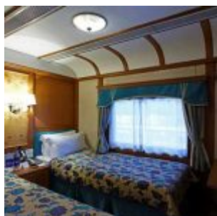
Deluxe Abteil Deccan Odyssey