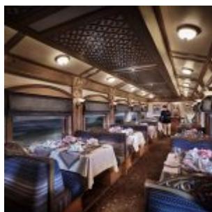
Deccan Odyssey Restaurant

Präsidentensuiten: Die Suiten sind mit einem Schlafzimmer, einem Aufenthaltsraum mit Sofa (auch als Bett nutzbar, 80 x 200 cm) und zwei Badezimmern ausgestattet. Weitere Ausstattung wie Superior.