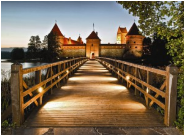
Burg Trakai, Litauen

Heute erfolgt ein Bustransfer in das Seenland von Litauen. Per Rad (Seenlandschaft, hügelig) erreichen wir Trakai mit der berühmten gotischen Inselburg aus dem 15. Jahrhundert im Galve See. Nach einem geführten Rundgang durch Trakai sind es nur noch ca. 30 Kilometer mit dem Bus weiter bis nach Vilnius, der Hauptstadt Litauens. Wir erleben Vilnius mit einem Stadtführer - eine Rundreise durch die Stadt und einen Spaziergang durch den Altstadt. Abends erwartet uns ein feierliches Abschiedsessen in einem Altstadtrestaurant mit litauischen Spezialitäten (Cepelinai, Koldunai, Blinas) erwartet. Übernachtung in Vilnius. Per Rad ca. 30 km, per Bus ca. 100 km