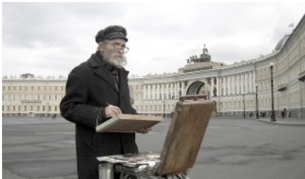
Russland, St. Petersburg Schlossplatz

Palast und wird als das achte Weltwunder bezeichnet. Nach der Mittagspause fahren Sie zum Peterhof . Die moderne Stadt Peterhof ist ein Vorort St. Petersburgs, liegt etwa 29 km weit von Sankt Petersburg. Die Stadt wird manchmal mit Versailles verglichen. Hier gibt es eine Reihe von Palästen und Gärten. Der erste Palast wurde im Jahre 1714 auf Befehl Peters des Großen gegründet. Er hat die ersten Zeichnungen und Designs gemacht. 1723 fand die Eröffnungsfeier statt. Der zweite Bauabschnitt wurde in den 1730er Jahren durchgeführt. Den größten Teil der Fläche umfassen die niederen Gärten. Das Herzstück des gesamten Komplexes ist der Grand Schloss. An seinem Fuß beginnt der Ostsee-Kanal, Morskoj Kanal, eines der größten Wasserwerke der Barockzeit. Sie besuchen hier den Park und die bekannten Brunnenanlagen.