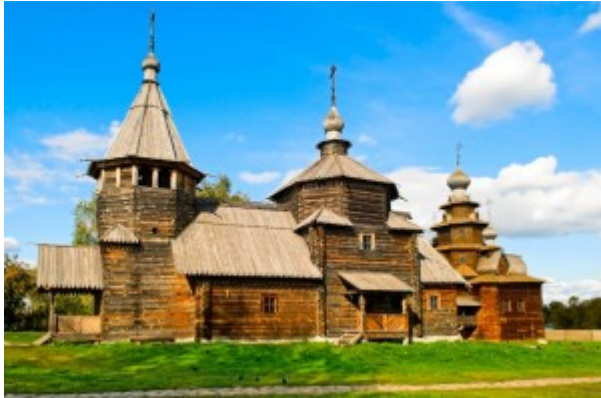
Susdal, Goldener Ring