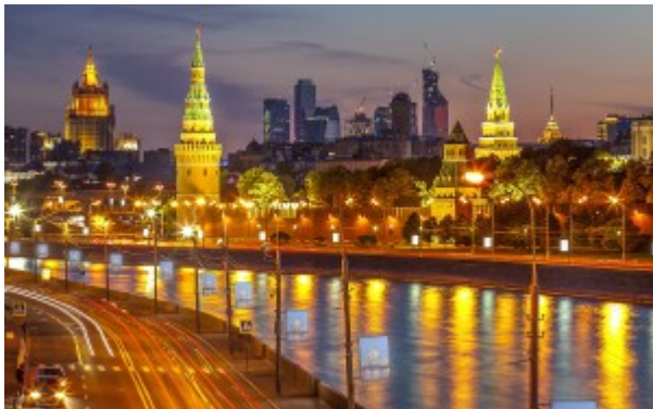
Moskau bei Nacht

Moskau, die Mutter Russlands, ist mit dem Kreml und den allgegenwärtigen Zwiebeltürmen eine original russische Stadt. Im Laufe der dramatischen Veränderungen der letzten Jahrzehnte ist die Stadt zu einer der dynamischsten Metropolen der Welt geworden. Auf der morgendlichen Stadtrundfahrt werden wir uns die Highlights dieser riesengroßen Stadt ansehen können: den Roten Platz mit Basilius-Kathedrale, den Theaterplatz mit dem Bolschoi-Theater, die „Sperlingberge“ mit der Moskauer Universität, sowie die weltberühmte Moskauer Kreml. Der Nachmittag bietet eine fakultative Besichtigung der Moskauer Metro, einschließlich der historischen Stationen auf dem Ring-Line und einem geführten Spaziergang entlang der berühmten Fußgängerzone Arbat-Straße. Der Abend bietet ein optionales Moskau bei Nacht Tour, einschließlich einer unvergesslichen Bootsfahrt mit der Weißen Flotte.