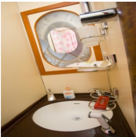
1.Klasse PLUS, Imperial Russia

1. Klasse Plus: 1-2 Person im Abteil, Klimaanlage, Heizung, 2 Liegeflächen 80×180 cm in size, Sessel, Tisch, Kleiderschrank, Gepäckregal, Waschbecken, Dusche, WC, Radio, Steckdose 220 V, Zugbegleiterknopf.