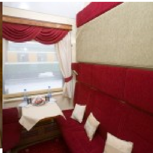
1. Klasse Plus im Zug Imperial