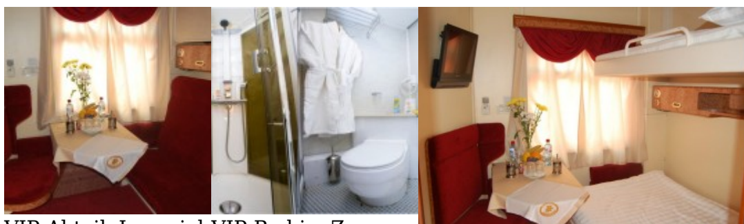
VIP-Abteil, Imperial Russia Zug VIP-Bad im Zug Imperial Russia

VIP: 1-2 Personen im Abteil, Klimaanlage, Heizung, 2 Liegeflächen (1 unten 120×180 cm und 1 oben 95×180 cm), Sessel, Tisch, Kleiderschrank, Gepäckregal, Waschbecken, Dusche, WC, TV mit DVD, Radio, Steckdose 220V, Zugbegleiterknopf.