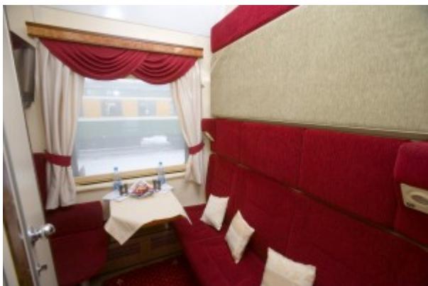
Imperial Russia (First Class)