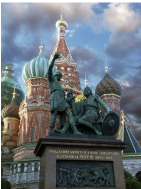
St. Basiliuskathedrale, Moskau