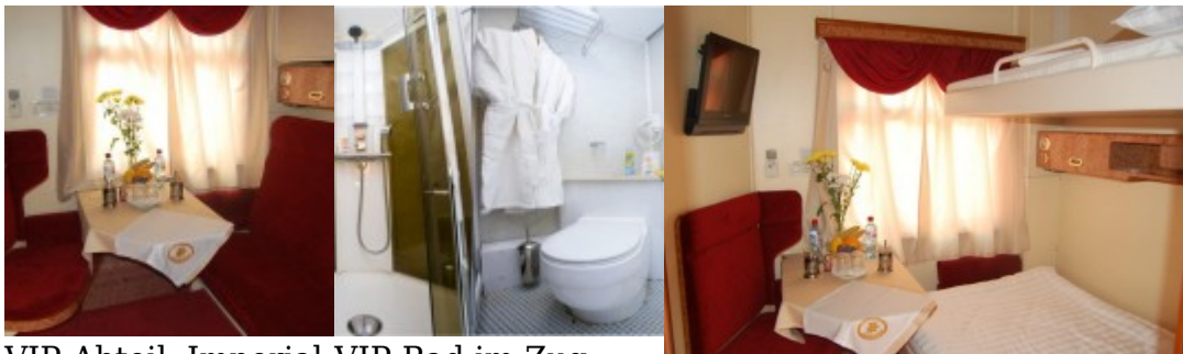
VIP-Abteil, Imperial Russia Zug VIP-Bad im Zug Imperial Russia

VIP: 1-2 Personen im Abteil, Klimaanlage, Heizung, 2 Liegeflächen (1 unten 120×180 cm und 1 oben 95×180 cm), Sessel, Tisch, Kleiderschrank, Gepäckregal, Waschbecken, Dusche, WC, TV mit DVD, Radio, Steckdose 220V, Zugbegleiterknopf.