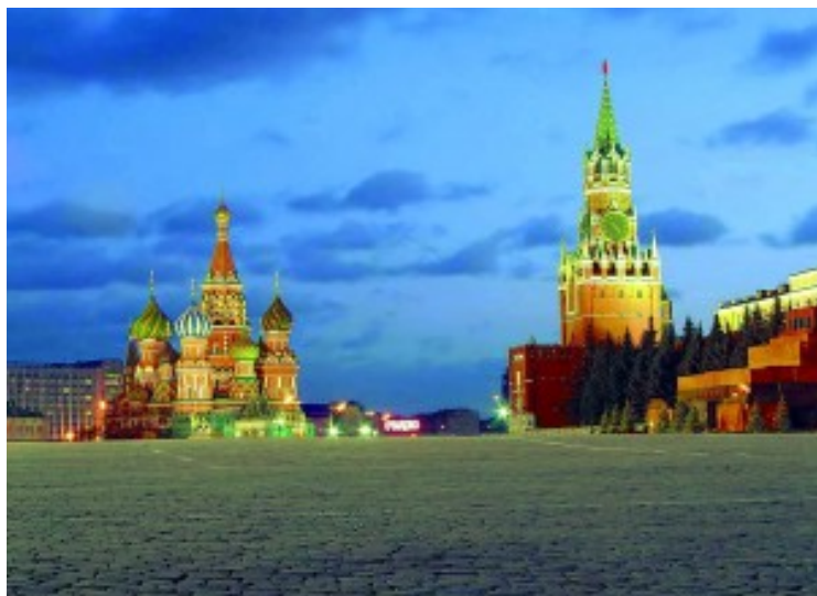
Moskau, Roter Platz

Messegelände und der Gedenkstätte für sowjetische Kosmonauten. Diesen Ausflug können Sie bei Buchung gleich mitbestellen, natürlich auch individuell und mit deutschsprachiger Reiseleitung. Weitere Ideen für Ihren Moskau Aufenthalt finden Sie in diesem Reisebericht .