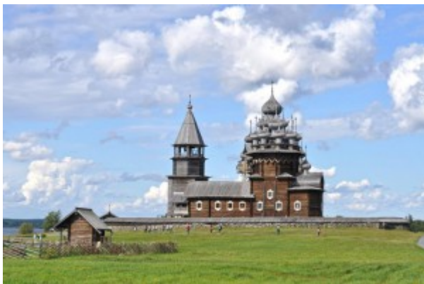
Insel Kizhi, Karelien

7-tägige Rundreise durch das Naturparadies Karelien. Sie erkunden schwer zugängliche Pfade und entdecken atemberaubende Plätze in dieser einzigartigen Landschaft die nur aus Wäldern und Seen zu bestehen scheint. Beobachten Sie die reiche Tier- und Pflanzenwelt. Highlights: Kizhi - Kiwatsch - Uspenskaya Kirche - Trekking mit Siberian Huskies - Ruskeala - Kinerma. Ab/bis St. Petersburg.