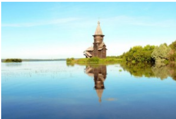
Uspenskaya Kirche, Karelien

Mittags Picknick mit Schaschlik, Tee und Gebäck.