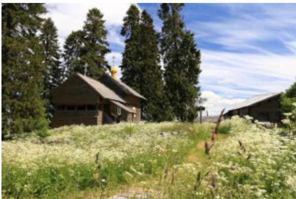
Dorf Kinerma, Karelien

11:00 Führung um den Marmor-Canyon . Hier bewundern Sie die unterschiedlichste Farben vom Marmor – Grau, Grün, Weiß und Schwarz. Im 18. Jahrhundert wurde der Ruskeala-Marmor z.B. für die Dekoration des Marmorschlosses und der Isaak-Kathedrale in St. Petersburg genutzt. Außerdem finden Sie den Ruskeala-Marmor auf dem Boden der Kazaner Kathedrale, auf den Decken der Eremitage und auf der Fassade des Michailow-Schlusses. Genießen Sie den atemberaubenden Blick auf die Marmor-Wände und den smaragdfarbenden See, welcher sich nach der Überflutung des Canyons nach dem Zweiten Weltkrieg bildete.