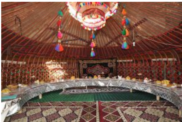
Tag 7 Kotschkor - Song-Köl (130 km, 3-4

(Mahlzeiten: Frühstück / Mittagessen / Abendessen)