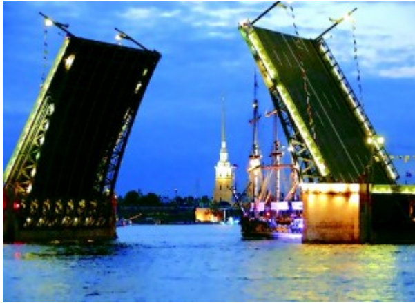
Schlossbrücke und Peter-Paul-Festung, St.